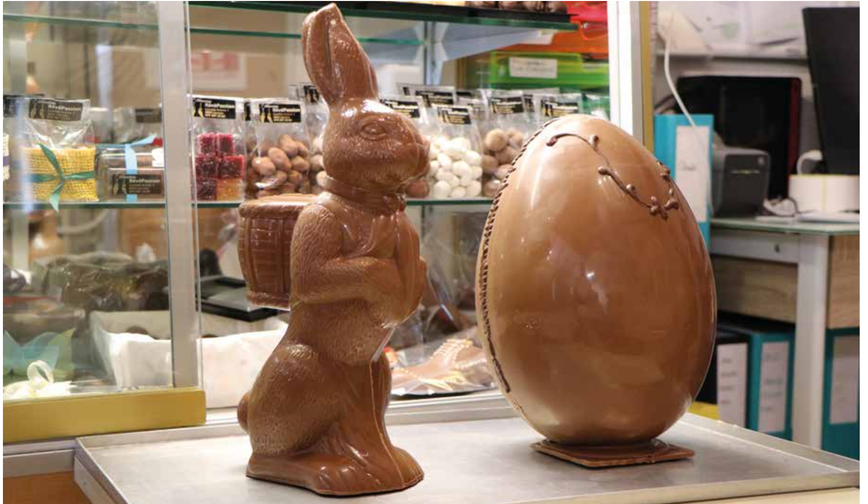
L'équipe de Val-de-Ruz info vous souhaite des Fêtes de Pâques chocolatées.