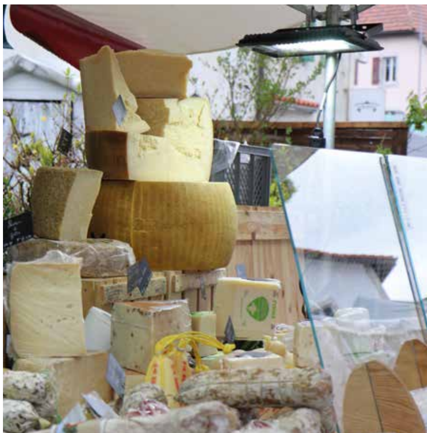
Foire de Coffrane: le stand fromage à se lécher les babines. (Photo pif).

Si vous désirez nous transmettre l'un ou l'autre événement qui anime la vallée, faites-nous parvenir vos informations par courriel à l'adresse redaction@valderuzinfo.ch , en n'oubliant pas de respecter les délais d'impression. Pour le numéro 276, dernier délai d'envoi 18 avril (parution 27 avril). Les lotos, vide-greniers, matches aux cartes, cours privés, ne sont pas référencés dans l'agenda. Pour ce genre de manifestations, il faut se référer à la rubrique petites annonces sur www.valderuzinfo.ch .