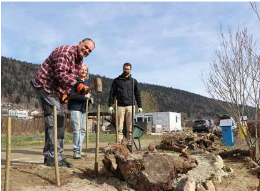
Les membres d'Espace abeilles se sont transformés en terrassier pour créer une zone de nidification pour les abeilles terricoles.

Si l'expansion du frelon asiatique inquiète tous les apiculteurs, les membres de l'association Espace abeilles ne mènent pas seulement un combat pour défendre les intérêts de la précieuse abeille domestique. Ils se préoccupent aussi de leurs cousines sauvages qui souffrent de l'urbanisation galopante.