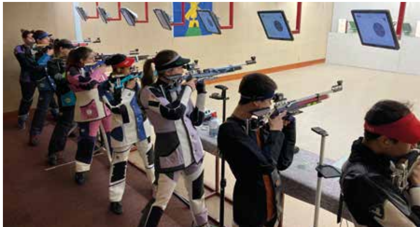
Avec neuf cibles électroniques, le stand de Montmollin est le mieux équipé du canton pour la carabine à air comprimé.

Deux titres individuels de champion de Suisse ainsi qu'une médaille de bronze: à l'heure de clôturer la saison indoors, la société de tir carabine air comprimé «La Rochette» Montmollin dispose d'une relève très prometteuse. Et ce n'est pas par hasard. Elle s'investit pour la jeunesse dans une discipline de tir à ne pas sous-estimer, puisqu'elle est olympique.