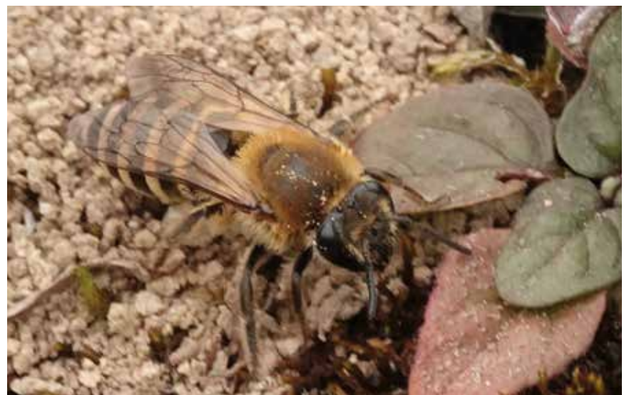
La collète du lierre, ici à Montézillon, nidifie dans le sol au moment de la floraison du lierre. Les œufs sont pondus dans de petites loges sur du pollen.