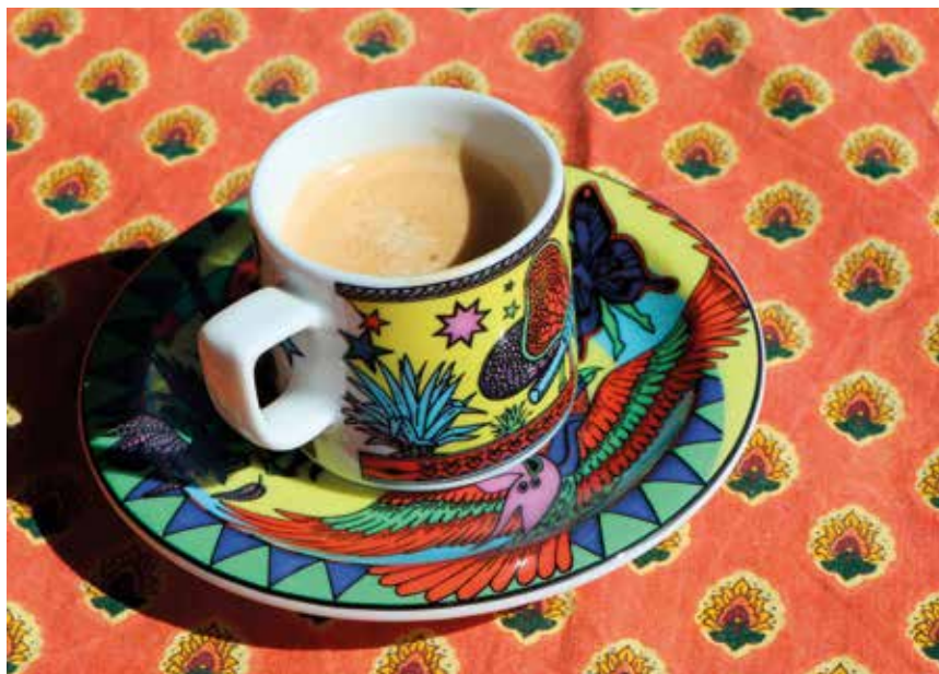
Le café à boire ensemble: un symbole de lien social.

Avec le vieillissement de la population et la volonté affichée des pouvoirs publics de maintenir le plus longtemps possible les personnes âgées à domicile, l'association «Là'Proches» estime aller dans le sens de prestations qui seront de plus en plus demandées. Celles-ci servent aussi à combattre l'isolement: «Il y a des personnes qui n'ont aucun contact social de la semaine». Renseignements et informations: Là'Proches, 079 659 26 77 /pif