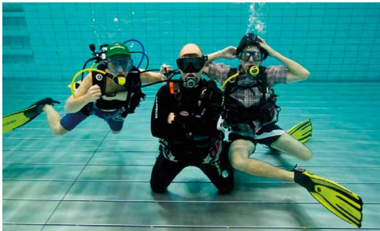
Un ton décalé et même déjanté: c'est Cliftown film.

L'association Cliftown Films a remis le couvert. Elle a organisé pour la deuxième année consécutive, les 1 et 2 avril, le FFFF (Fontainemelon Fuper Film Festival): «Du cinéma vivant» selon les propos des organisateurs. Mais les activités de Cliftown Films ne se limitent pas à ce festival. Elles comprennent aussi le ciné-club et une part