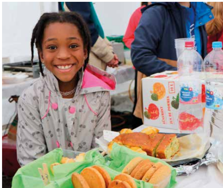
A la foire de Coffrane, les écoliers et écolières proposent des pâtisseries.