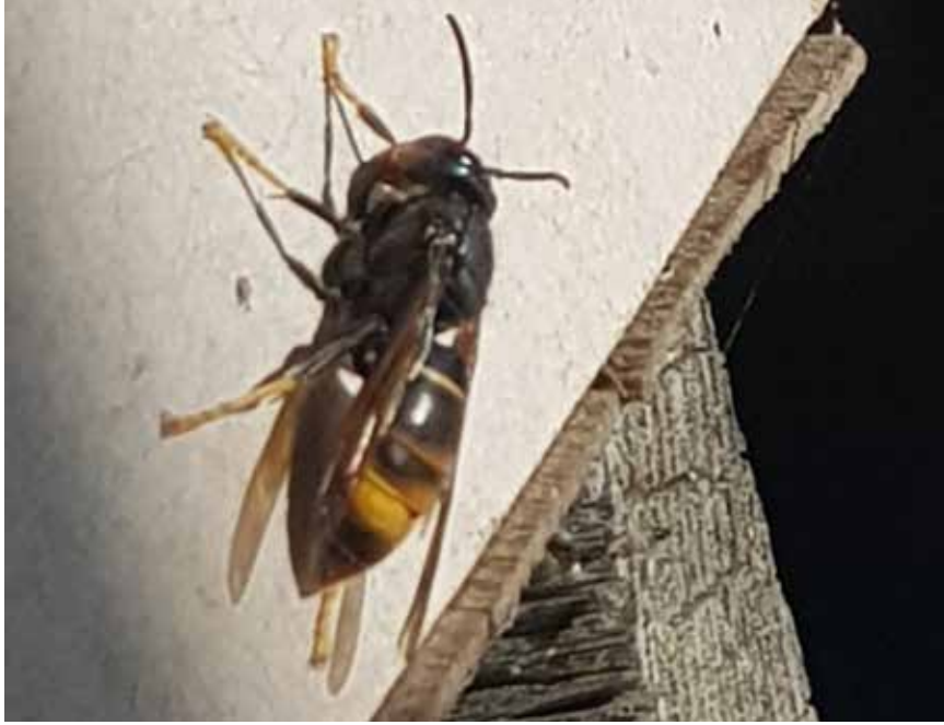
Un premier frelon asiatique a été repéré l'automne dernier à Espace abeilles, sur le site d'Evologia. (Photo Espace abeilles).

Le frelon asiatique a frappé à la porte. Et il n'est pas bienvenu. Au mois de septembre de l'an dernier, cet hyménoptère d'une taille supérieure à la guêpe avait été signalé à Espace abeilles sur le site d'Evologia à Cernier. Une première