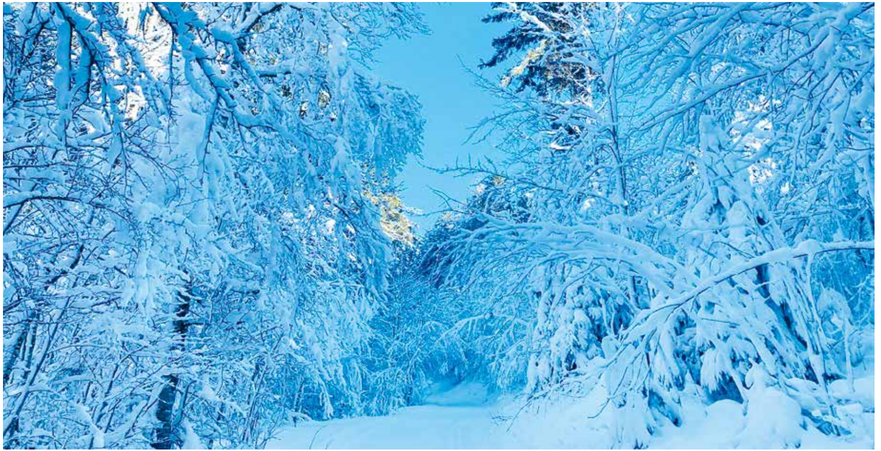
Durant les Fêtes, c'était exceptionnel: les hauteurs du Val-de-Ruz ont été gratifiées d'un enneigement qui a fait le bonheur des amoureux de la nature et de la randonnée.