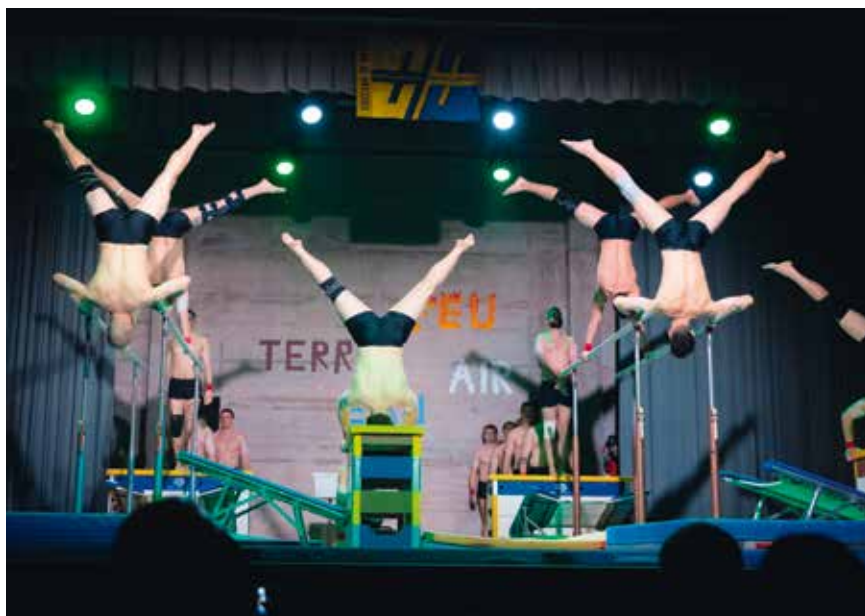
La Gym Chézard présentera sa soirée annuelle les 7 et 8 février.