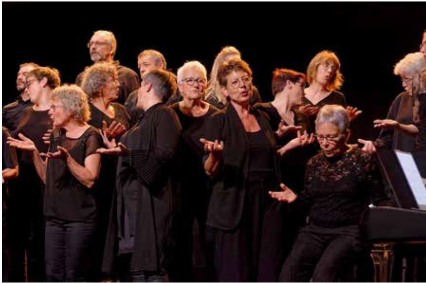
La Tarentelle en plein concert.

Le chœur mixte La Tarentelle a 40 ans. L'occasion de porter son regard sur cette société de Savagnier fondée en 1985, qui a connu une érosion du nombre de ses membres à la suite de la période Covid. La chanson française constitue son fonds de commerce.