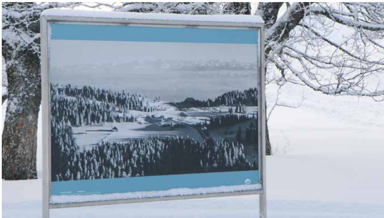
Exposition en plein air de photos à découvrir, entre La Vue-des-Alpes et Tête-de-Ran.

Courrier: Val-de-Ruz info Grand'Rue 64 2054 Chézard-Saint-Martin Internet: www.valderuzinfo.ch rubrique annonces/petites annonces