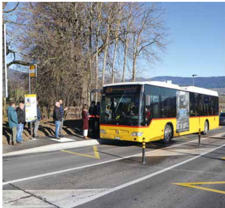
Les bus s'arrêtent enfin à Malvilliers (photo pif).

C'est une première pour Malvilliers: le hameau de l'ouest du Val-de-Ruz dispose enfin d'une desserte de transports publics. L'arrêt de bus «La Chotte» sur la ligne 424 est opérationnel depuis la mi-décembre. Il était attendu depuis longtemps et son implantation s'inscrit aussi dans le cadre du développement de la zone artisanale de Malvilliers.