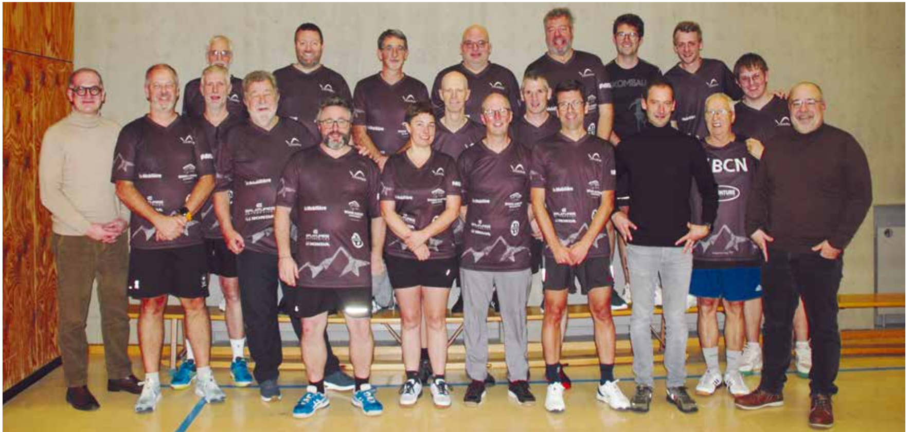
La photo de famille du CTT Val-de-Ruz avec le nouveau maillot.

Tous sous la même bannière en ping-pong! Les deux clubs de la vallée, le CTT Coffrane et le CTT Cernier, avaient officiellement fusionné le 22 mai 2023 pour donner naissance au Club de tennis de table du Val-de-Ruz. Celui-ci est résolument tourné vers l'avenir.