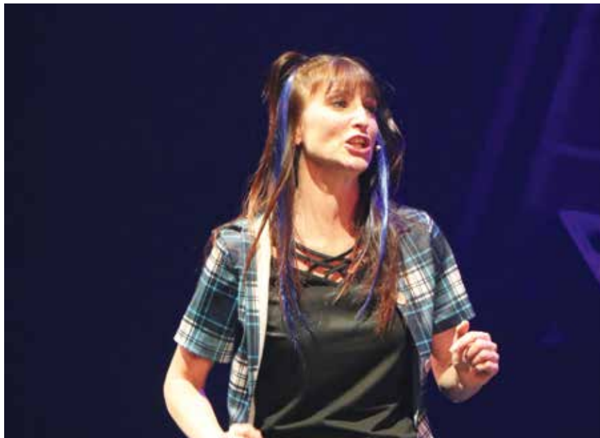
La kiosqueuse Manchette était au centre des ragots (photo pif).

La Décharge a mitraillé tous azimuts à la Grange aux concerts de Cernier lors de sa revue 2025, entre le 31 décembre et le 18 janvier. Elle a visé avec humour aussi bien les acteurs de l'actualité régionale, que nationale ou qu'internationale. Fidèle à sa réputation, elle a aussi porté avec sensibilité son regard sur des faits graves et tristes comme la guerre à Gaza.