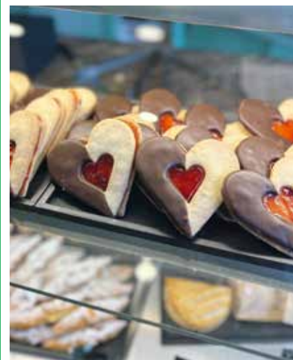
Des cœurs pour la bonne cause.

L'intégralité des bénéfices financera l'organisation du Mercredi découverte et partage de la Croix-Rouge neuchâteloise qui permet à tous les enfants du canton de participer à des activités extra-scolaires très diversifiées. En 2025, les bénéficiaires se rendront notamment à la patinoire, participeront à des ateliers samaritaines et pompiers, se défouleront sur la piste Vita ou seront encore initiés au processus chimique de gélification ou encore à la médiation animale. /comm-pif