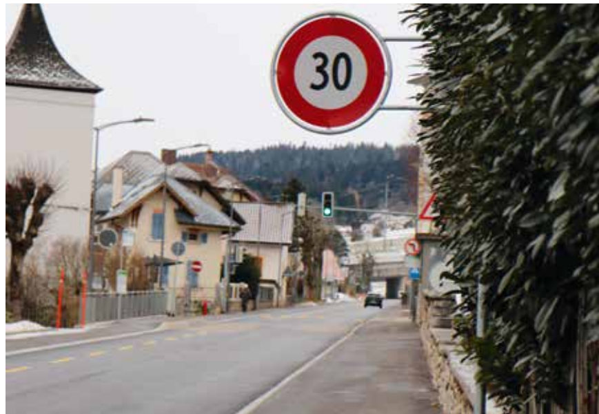
Le 30 km/h fait jaser à Fontainemelon.

La vitesse est désormais limitée à 30 km/h sur la route principale qui traverse le village de Fontainemelon. Cette mesure n'est pas instaurée pour le plaisir de ralentir les automobilistes. Elle a ses raisons. Décryptage en six points.