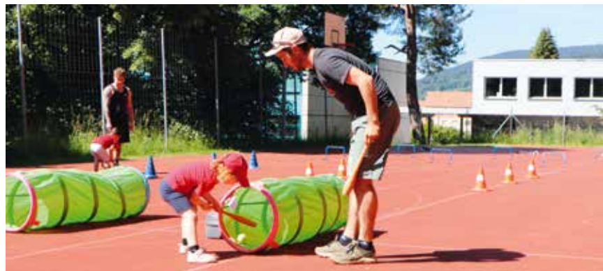
Le parent doit guider son bambin.

Cette experte fédérale donne des cours au Locle depuis une quinzaine d'années. Elle relève qu'il y a désormais plus de pères que de mères qui accompagnent leur petit bout de chou. Elle a aussi perçu une évolution dans l'attention des enfants: «Aujourd'hui, il me paraît que ceux-ci se focalisent plus difficilement sur l'objectif à atteindre». Un constat qui l'interpelle! /man