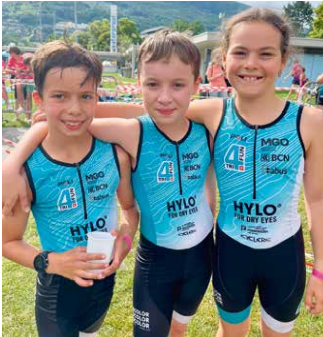
La relève du Tri4Fun Val-de-Ruz sera certainement aussi présente à son triathlon.

Nager, pédaler, courir: la 12 e édition du Triathlon de Val-de-Ruz est programmée samedi 4 juillet sur le site de la piscine d'Engollon. Avec toujours le maintien du format olympique. La course est précédée, deux jours avant, d'un triathlon des écoles. Ou quand fournir un effort devient ludique.