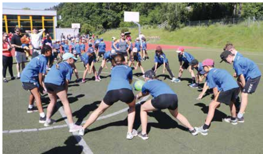
C'était aussi la fête régionale des sociétés du Val-de-Ruz.

La fête régionale de gymnastique a réuni les sociétés du Val-de-Ruz l'espace d'un week-end, les 13 et 14 juin, à Cernier. La fête cantonale parents-enfants s'est tenue en parallèle: un moment de partage entre un parent et son marmot qui vise à développer les qualités de coordination si précieuses pour favoriser la motricité.