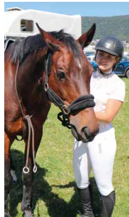
Pour un amour de cheval (photo pif).

la participation est essentiellement régionale, il y avait peut-être parmi ces cavaliers et amazones en herbe, les champions de demain. /man