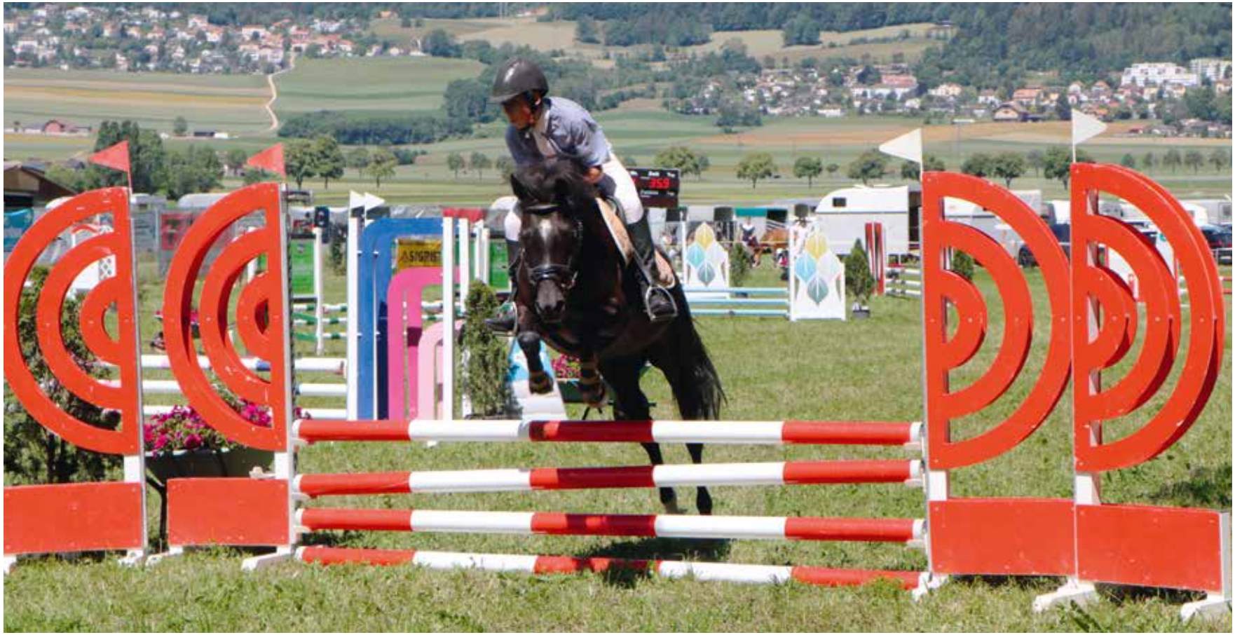
En page 11: le concours hippique d'Engollon est taillé sur mesure pour la relève au saut d'obstacles. Il a bénéficié de conditions idéales cette année.