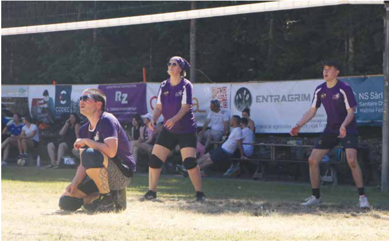
Un tournoi de volleyball ouvert à tous à Savagnier.