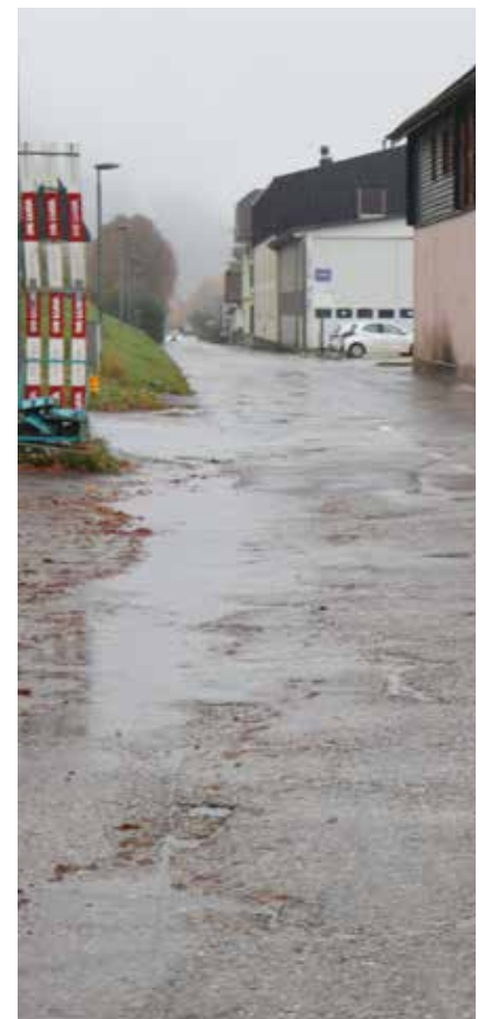
La rue des Esserts est fortement dégradée.

La rue des Esserts est fortement dégradée et le Conseil communal juge ces travaux indispensables. Ceux-ci comprendront la création de cheminements piétonniers sécurisés, partiellement séparés par des bandes végétalisées. Côté est, ce cheminement sera prolongé jusqu'à la rue de la Quarettte à Chézard-Saint-Martin, afin de modérer la vitesse des véhicules en provenance des Vieux-Prés. /comm-man