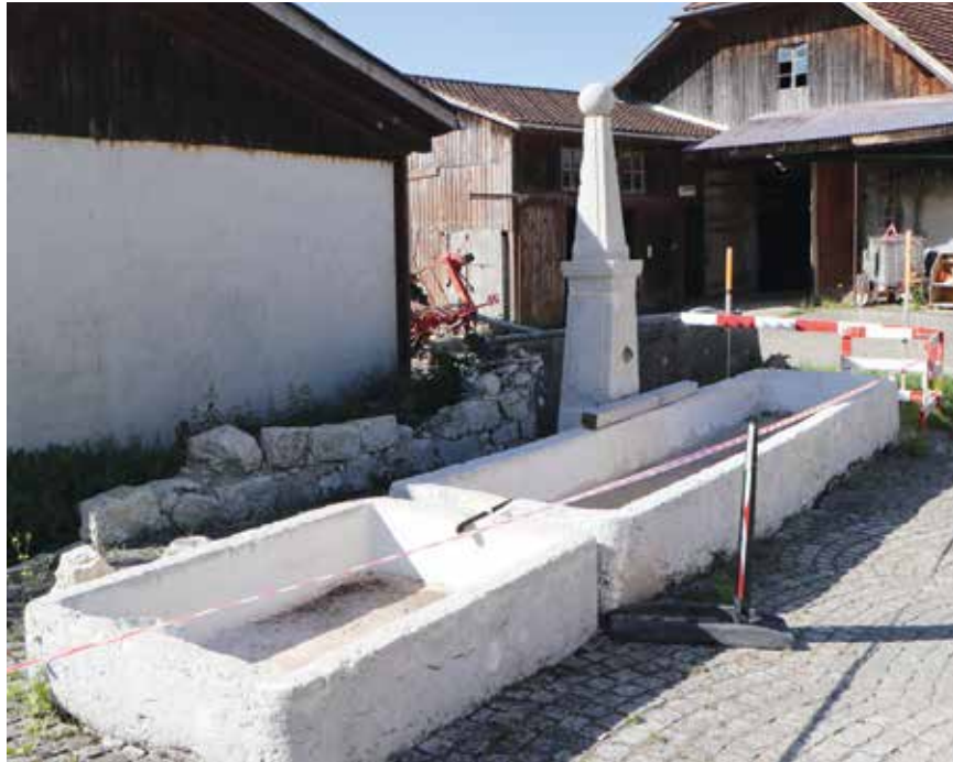
En face du collège du Pâquier, les travaux de restauration de la fontaine sont en cours.

La remise en eau des fontaines du Pâquier deviendra réalité. Ce qui peut paraître d'autant plus paradoxal dans un village dont le précieux liquide manque en période d'étiage. Ce projet ne fera pas recours au réseau d'eau potable.