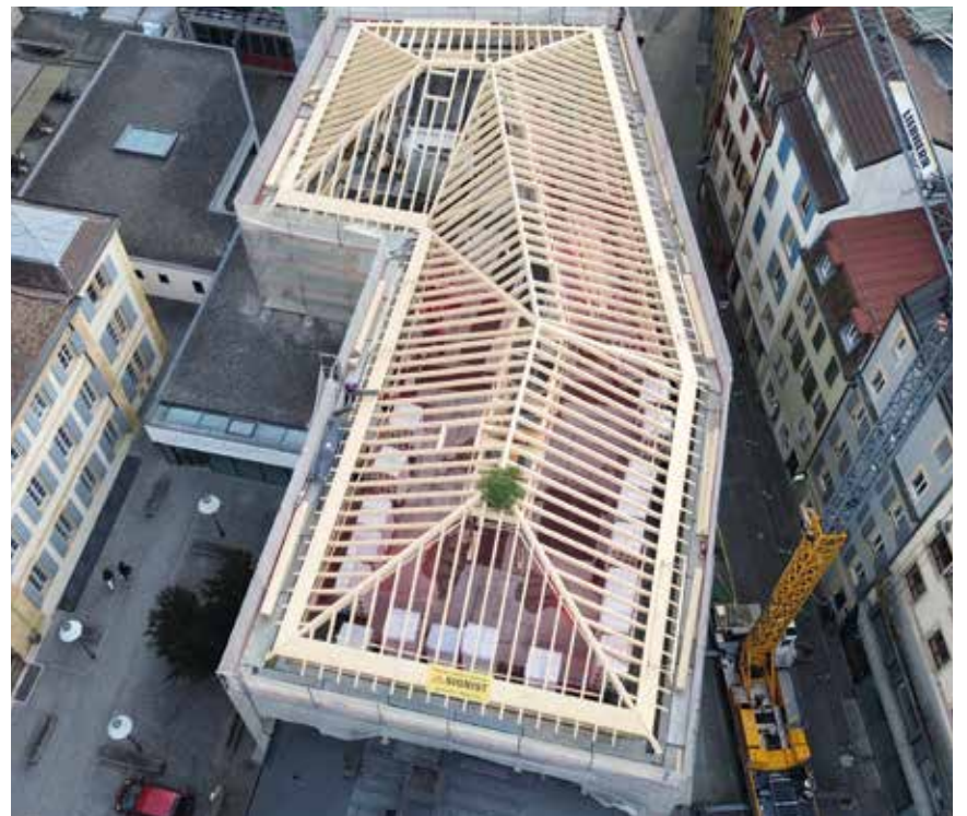
Une charpente en bois réalisée par l'entreprise Sigrist.

Mais, bien avant cela, il prépare la fête du 150 e . Entre anciens et nouveaux employés, fournisseurs, principaux clients, autorités, il a invité quelque 200 personnes à venir partager, dans la halle principale de sa société, une paella géante. /man